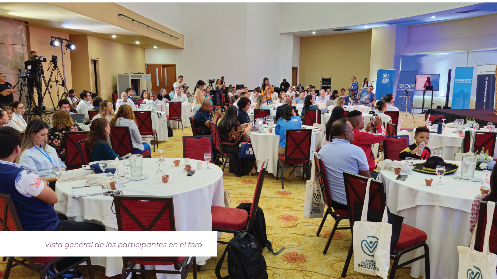
Vista general de los participantes en el foro

Las memorias del evento sistematizan reflexiones clave derivadas de las discusiones, constituyendo un recurso invaluable para el entendimiento y mejora de políticas de integración urbana. Estas no solo capturan un momento crucial para ciudades más inclusivas, sino que también inspiran a futuras iniciativas para promover la solidaridad y la inclusión en diversas comunidades.