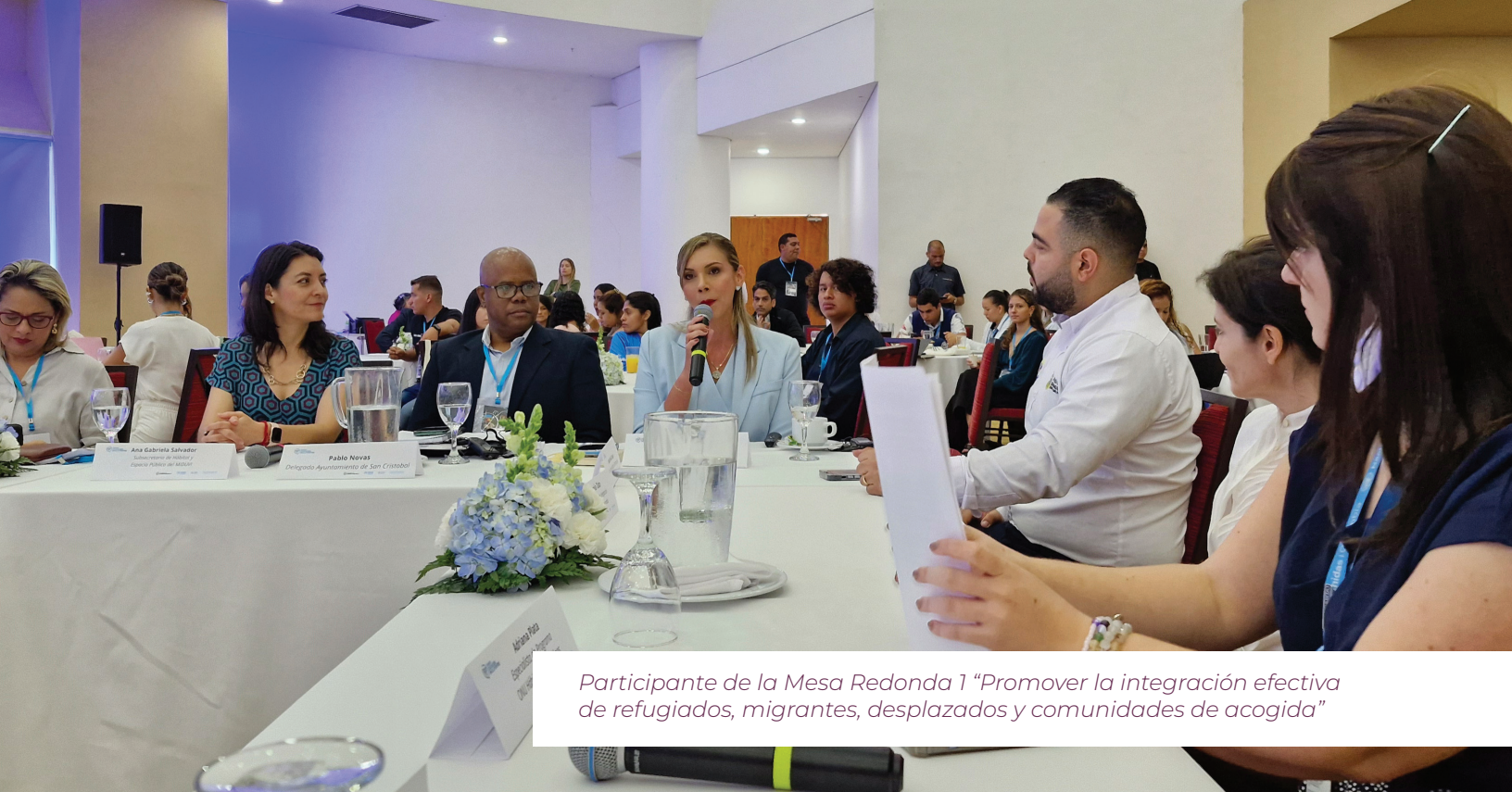
Participante de la Mesa Redonda 1 “Promover la integración efectiva de refugiados, migrantes, desplazados y comunidades de acogida”