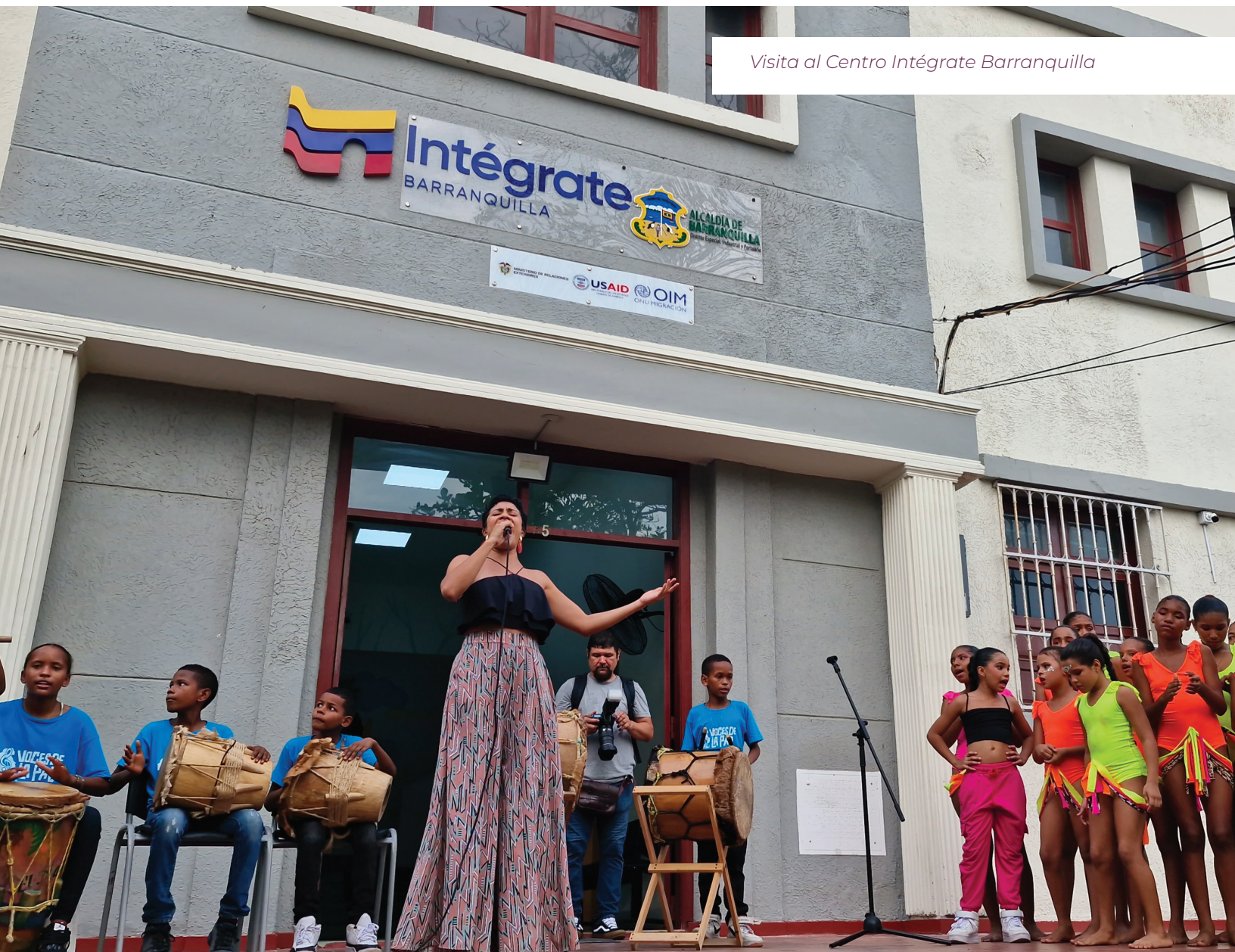
Visita al Centro Intégrate Barranquilla

Además, se destacan programas específicos para la prevención de la trata de personas y la violencia basada en género. Barranquilla se distingue por ser una de las ciudades con mayor número de población refugiada y migrante en Colombia, acogiendo actualmente a cerca de 150,000 personas de Venezuela, lo que subraya la importancia de iniciativas como el Centro Intégrate para facilitar su integración y mejorar su calidad de vida.