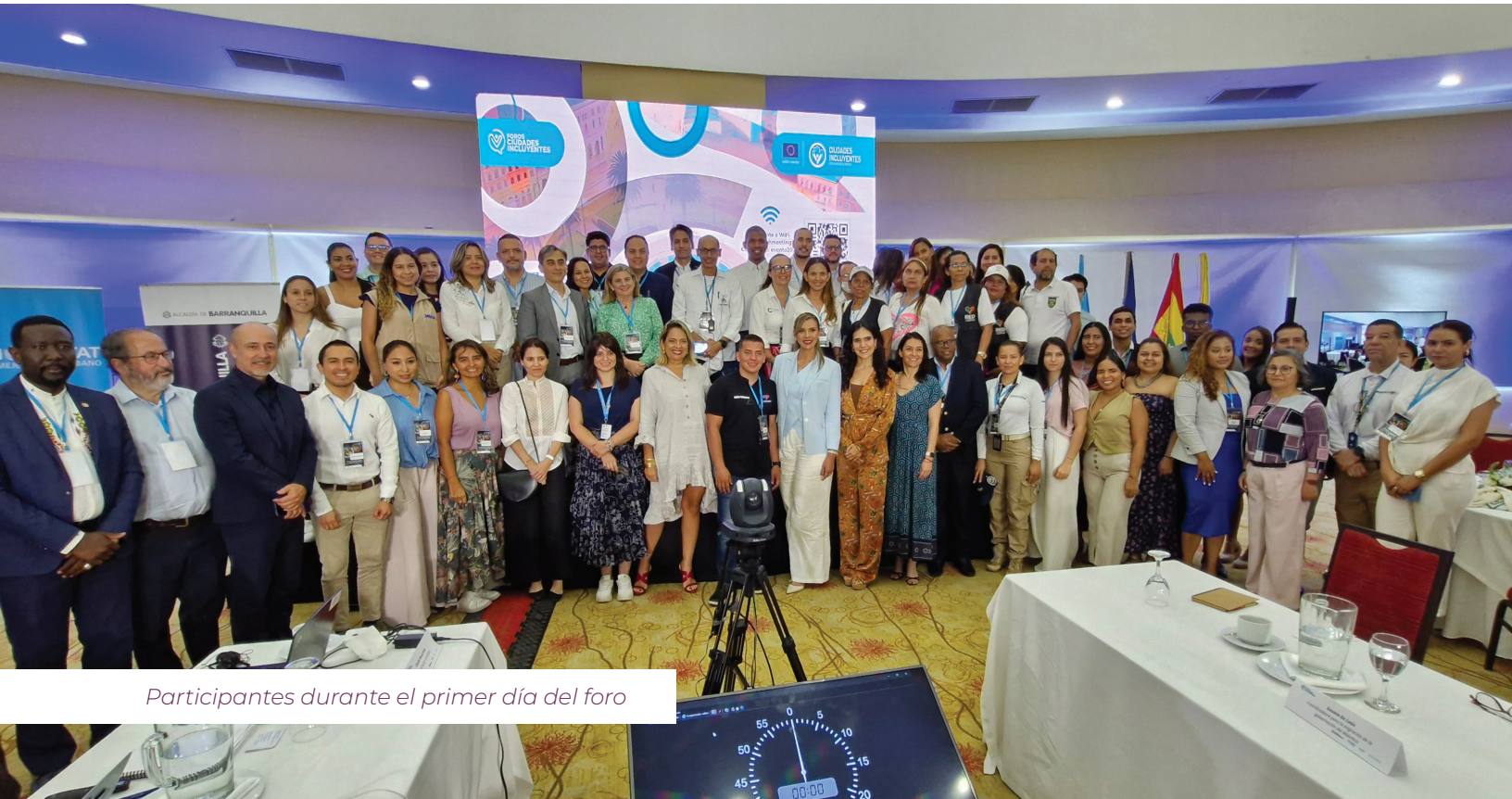
Participantes durante el primer día del foro