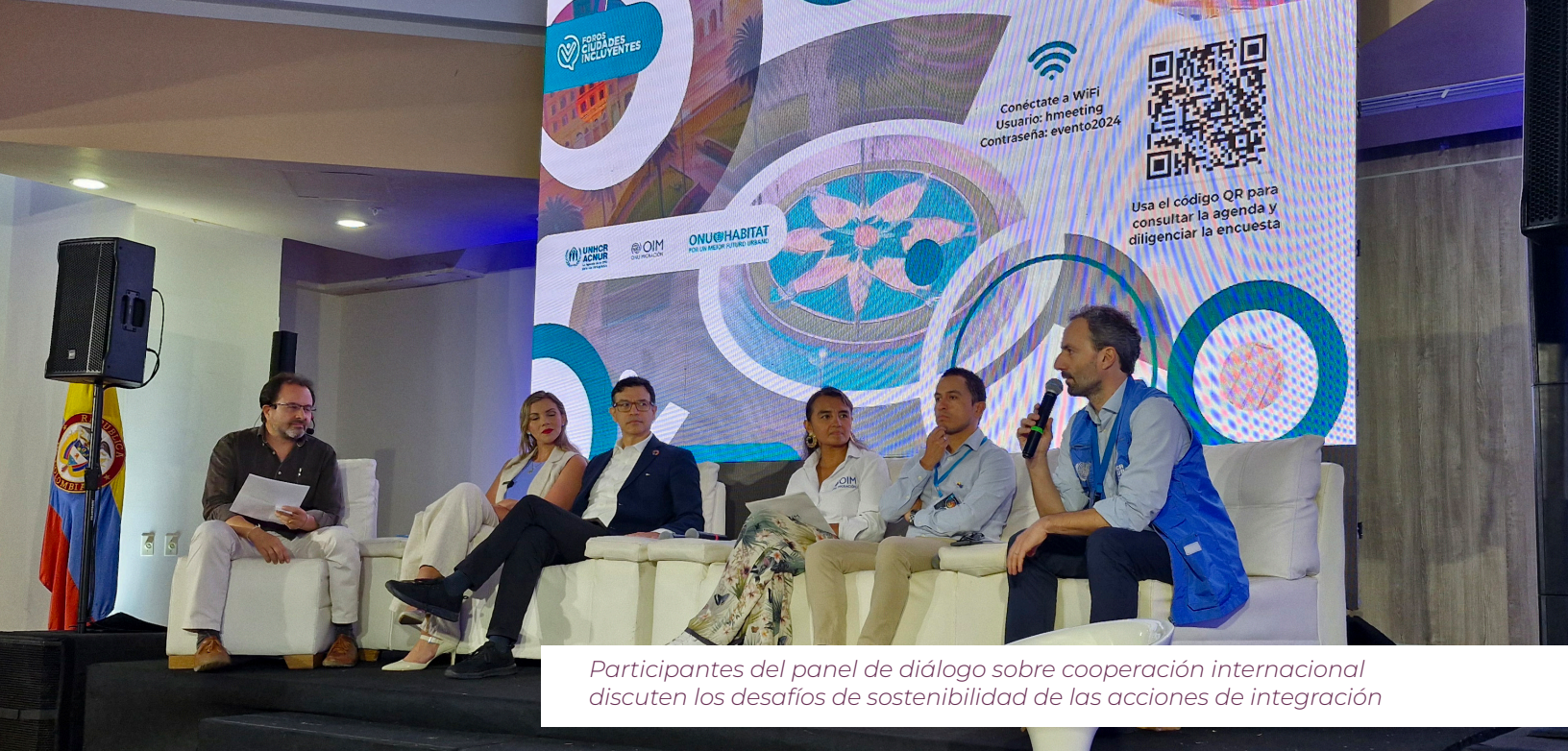
Participantes del panel de diálogo sobre cooperación internacional discuten los desafíos de sostenibilidad de las acciones de integración