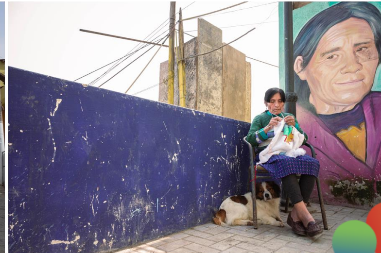
Desarrollo de emprendimientos locales