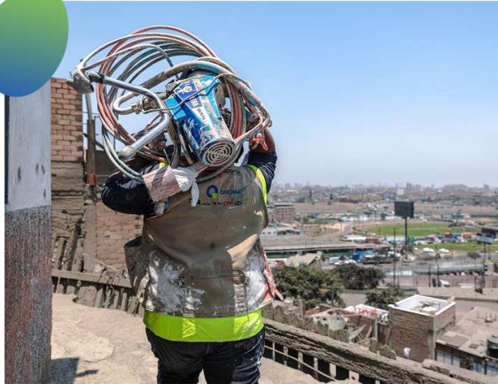
Secuestro de la máquina mezcladora de pintura

Presencia de distintos grupos e intereses que tuvo que enfrentar el equipo local