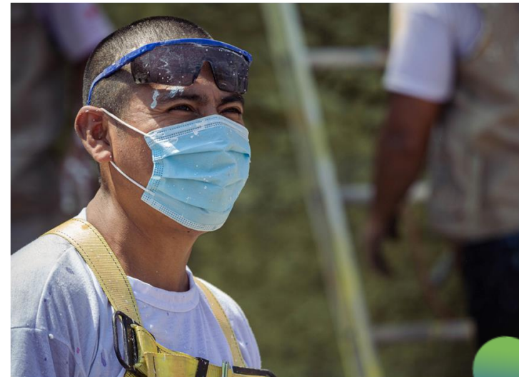
Mayor autoconfianza para asumir nuevas responsabilidades