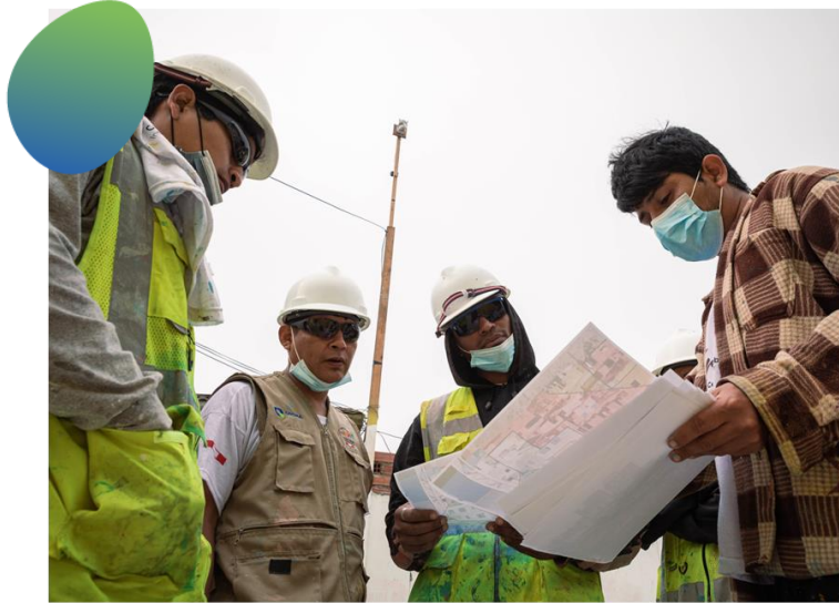
Coordinación con los 12 Comités vecinales de Leticia

Fortalecer los espacios de comunicación, compromiso e identificación con el proyecto