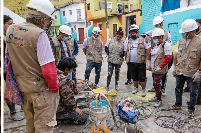
Consolidar la dinámica de trabajo (compromiso y puntualidad) y posicionamiento del proyecto