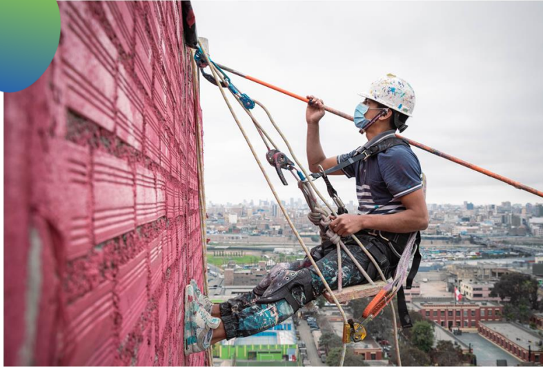
Crear y capacitar al "Equipo de Altura"

Adaptar el trabajo a la ubicación y dificultad geográfica de Leticia