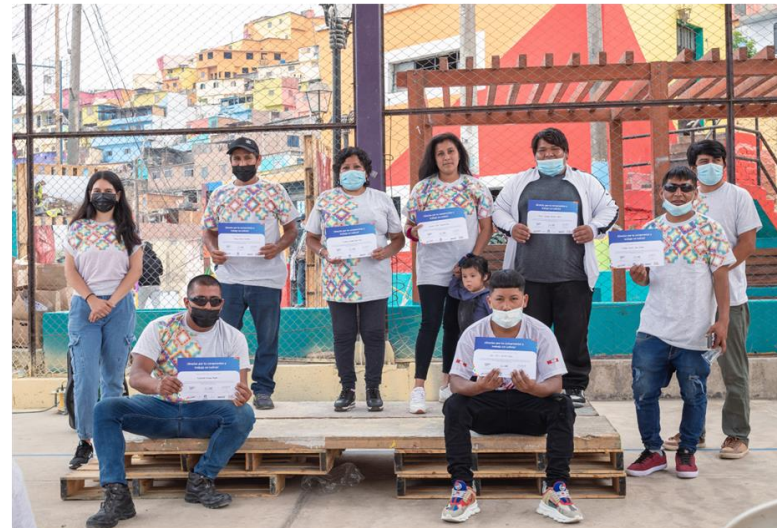
Ceremonia de Clausura para festejar y agradecer el compromiso de tod@s

OPORTUNIDAD Reconocimiento por el trabajo y fortalecimiento de confianza