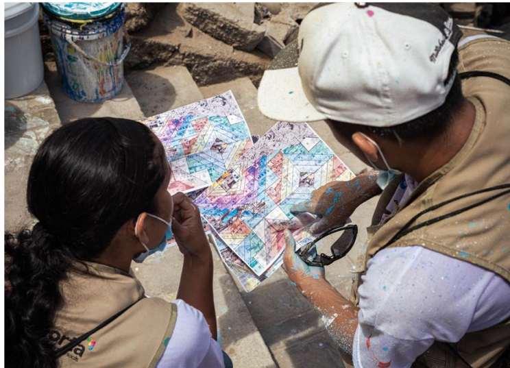
Grupos rotativos con personas de diferentes Comités Vecinales

Gran integración y confraternidad del equipo de pintado