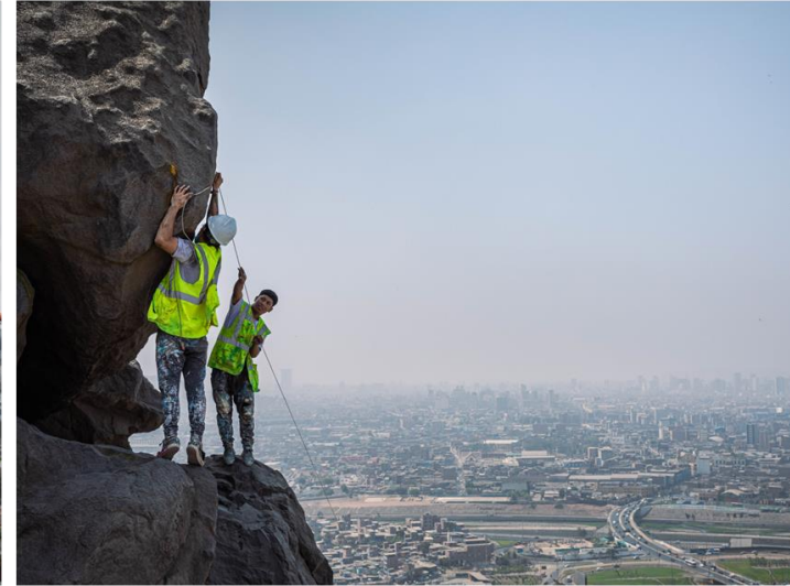
Pintar en lugares retadores

OPORTUNIDAD Reconocimiento por el trabajo y fortalecimiento de confianza