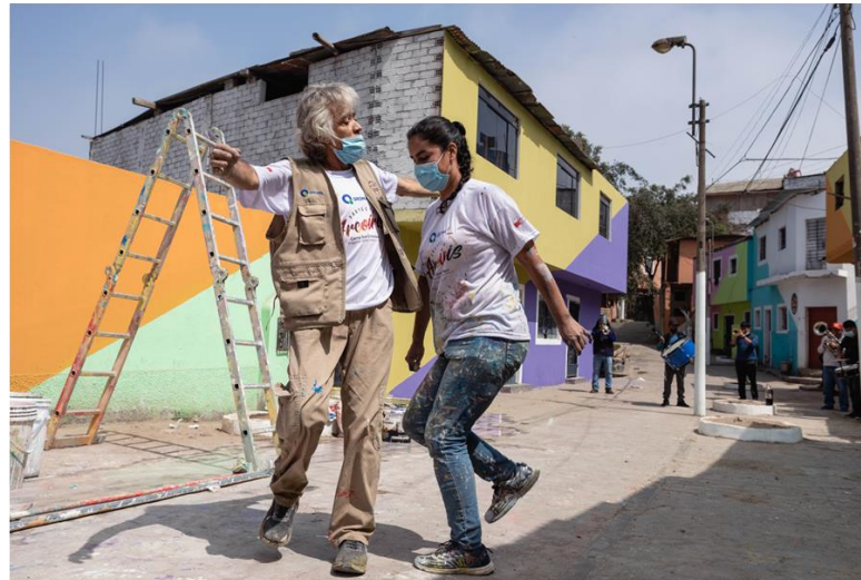
Valiosa participación de las personas adultas mayores

Nuevas oportunidades y habilidades desarrolladas