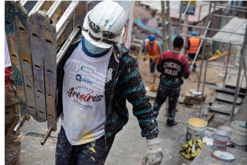
Negociaciones con los grupos de extorsionadores en la zona