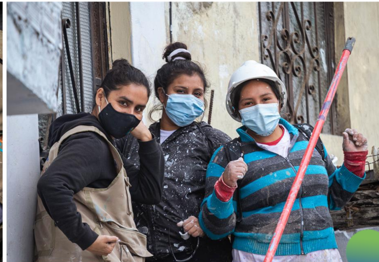
Amistad y reencuentros familiares y amicales entre lo que es "Leticia alta y bja"