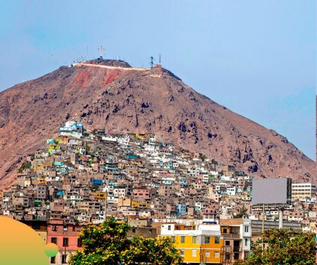
ANTES (Abril 2021)