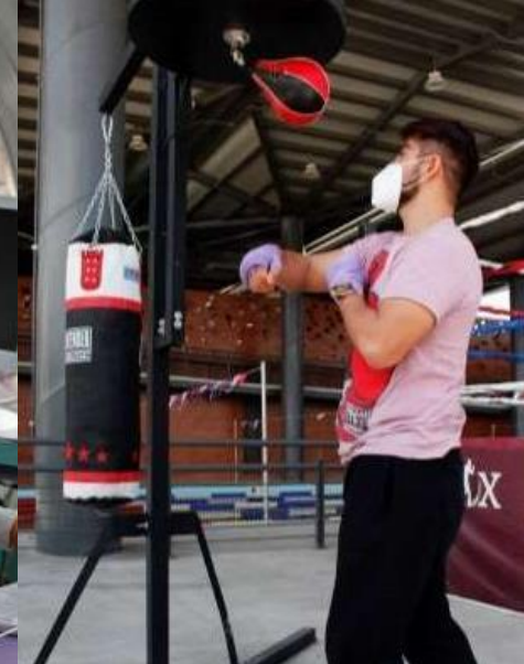
UTOPIA Teotongo / 20,106 m 2